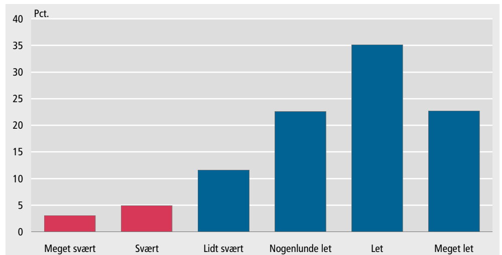
Figur 1. Hvor let eller svært er det for husholdningen at få pengene til at slå til? 2008

Sværest for arbejdsløse, lettest for selvstændige