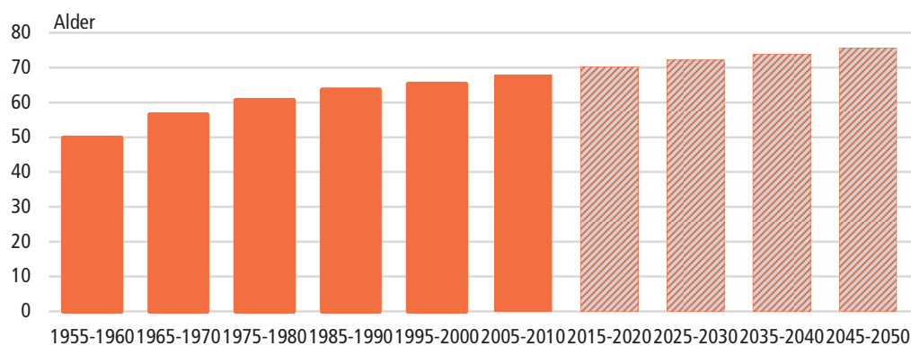
Figur 2 Gennemsnitlig forventet levetid for nyfødte over hele verden

Samtidig med, at vi bliver flere mennesker på jorden, lever vi også længere. I 1960 var den forventede middellevetid for alle verdens nyfødte børn i gennemsnit 50 år. I 2010 var den forventede middellevetid steget til omkring 68 år. I 2050 forventes middellevetiden at være steget til knap 76 år. Tallene dækker over meget store forskelle mellem lande og verdensdele. Et barn født i Japan i 2010 kan forvente at blive mere end 82 år, mens et barn født i Mozambique i Afrika kun kan forvente at fylde 39 år.