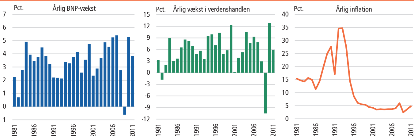
Figur 4 Nøgleindikatorer for verdensøkonomien

Set over de seneste 30 år har verdensøkonomien været i stabil vækst med en gennemsnitlig årlig realvækst på 3,6 pct. af verdens samlede BNP. Periodens mest udtalte konjunkturedgang var i 2009, hvor BNP for verdensøkonomien som helhed faldt med 0,6 pct. Ligeledes har tiden siden 1980 generelt vist en øget verdenshandel, men med en kraftig tilbagegang i 2009 pga. den finansielle krise. Forbrugerpriserne (inflationen) har de seneste år været på et historisk lavt niveau i de vestlige lande, dog med en kraftig stigning isoleret set i 2008.