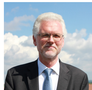
Jørgen Elmeskov Rigsstatistiker

Det er ligeledes muligt at følge op på implementeringen af arbejdsplanen fra det forgangne år, 2018, på www.dst.dk/arbejdsplan .