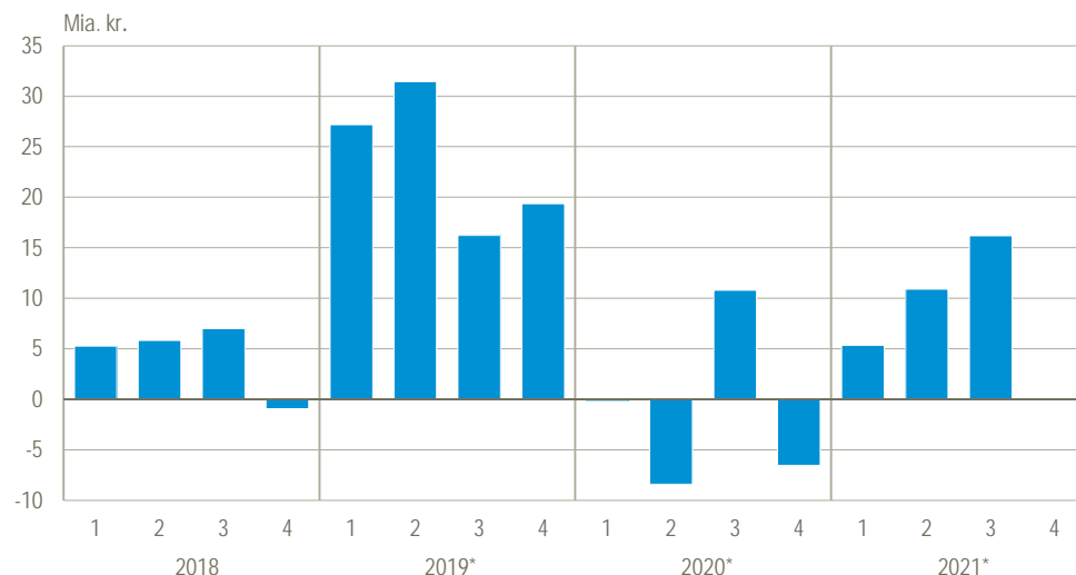
Figur 2. Den offentlige saldo (fordringserhvervelsen, netto)