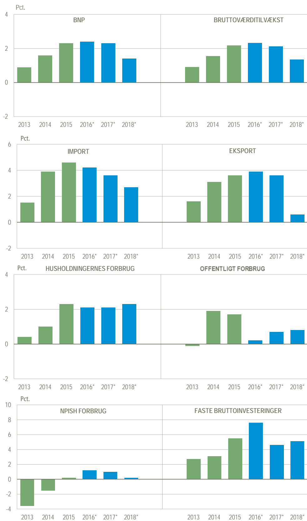
Figur 3. Årlig realvækst

I figur 3 nedenfor er vist den årlige procentvise realvækst i kædede værdier for nationalregnskabs hovedstørrelser på forsyningsbalancen for perioden 2011-2016.