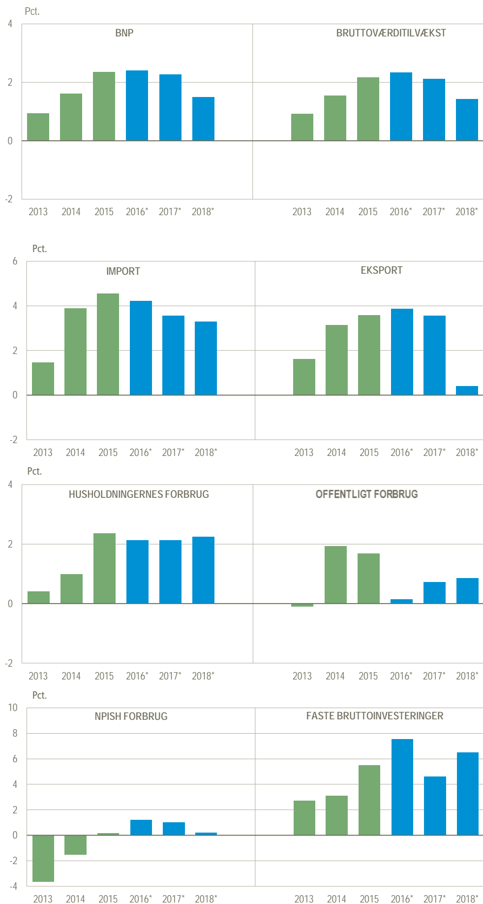
Figur 2. Årlig realvækst